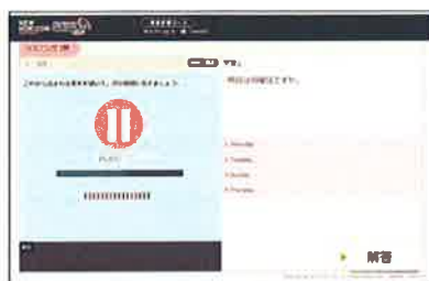
▲教科書準拠リスニング問題