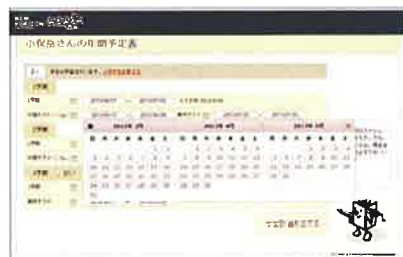
▲スケジュールの入力画面

こうした機能により、学習計画と見通しが立てやすくなり、学習の習慣化に役立ちます。