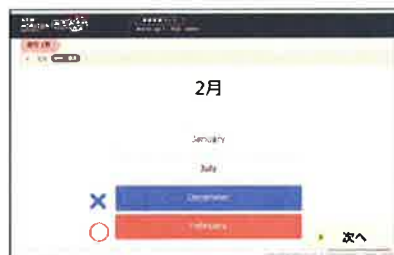
▲単語・文法の教科書準拠問題

演習結果、正答・誤答の記録をその後の学習に活用する仕組みとなっており、個人の傾向に合わせた学習(アダプティブ・ラーニング)を進めることができます。