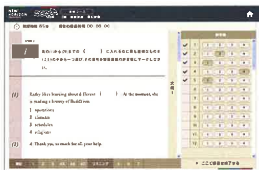
◀「英検対策コース」の演習画面

問われている内容は同じでも、学校の定期テストとは異なる形式で出題されると間違えてしまう、ということが無いよう十分な演習が行えるようになっていきます。