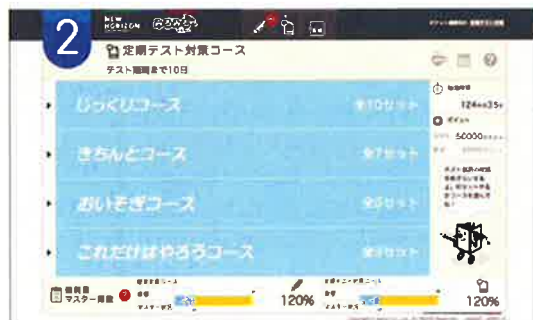
◀「じぶん問題集」のトップ画面

日常学習の蓄積が多いほど、「じぶん問題集」の出題構成は苦手な問題や間違えやすい問題とその類題を中心とした、個人に最適化された構成になります。