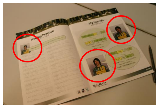
(FC 岐阜の選手が登場するオリジナル教材)

英語検定協会では、学習者が定期的に『英検』や『児童英検』で自己の英語レベルを確認することで、学習意欲を持ち続けていけるようサポートし、PFS の学習効果を高めるよう協力していきます。