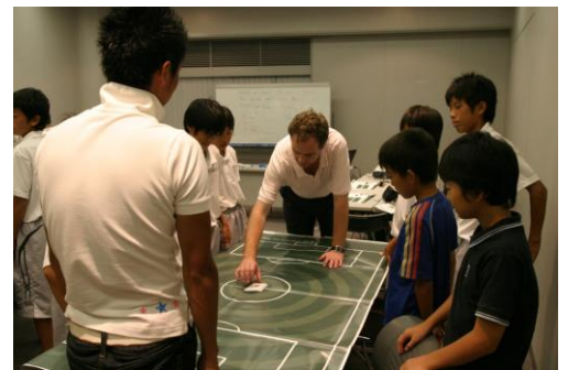
(FC 岐阜英会話スクールの様子)

PfSは、サッカークラブやその他のスポーツセンター等で英語・数学の学力、およびICT能力の向上を図り、生徒の自信と学習意欲を育むことを目的としたイギリス政府公認の教育プログラムです。イギリスやオランダではすでに約30万人に利用されています。イギリスでは160カ所以上のPfSセンターがあり、イギリスプレミアリーグおよびフットボールリーグの全チームをはじめとするサッカークラブやその他19のスポーツ(ゴルフ、ラグビー、クリケット、バスケットボールなど)がPfSに参加しています。現在、スペイン、アメリカ、ベルギーなどでも導入を積極的に検討しており、今後も世界中の多くの国で広がりを見せていくことが予想されます。