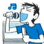
12. sing karaoke