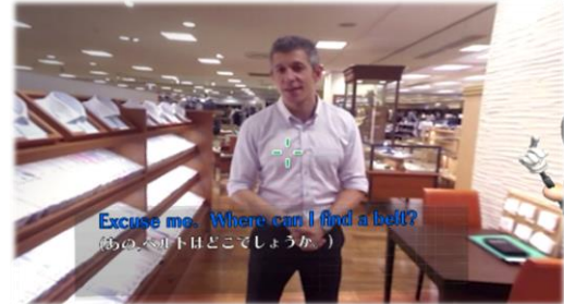
(接客トレーニングのイメージ例)

公益財団法人 日本英語検定協会（理事長：松川孝一、所在地：東京都新宿区、以下、「英検協会」）は、このたび、売場の接客担当者向けの VR アプリ、「売場のやさしい英会話 VR」を開発し、テキストや CD を含む英語教材として 5 月から提供を開始いたしました。詳細は末頁をご覧ください。