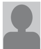
写真 タテ3cm× ヨコ2.4cm